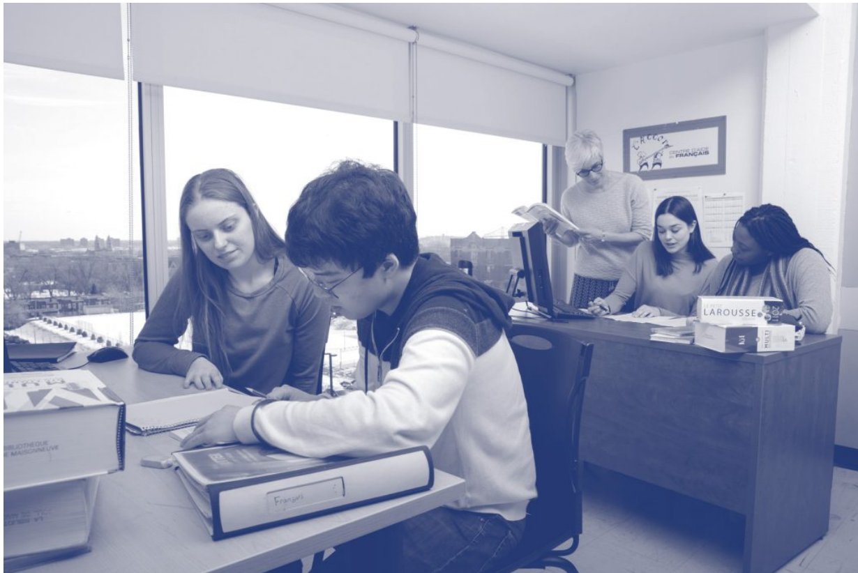
Des élèves en plein travail dans les locaux de L'Accord.

Au fil des nouveaux besoins et de la demande grandissante, le SIFÉ devra souvent déménager, passant du réduit dans la bibliothèque, au quatrième étage, à deux bureaux : un pour l'enseignant ou l'enseignante et un autre pour la technicienne, dans le corridor du troisième étage, à côté des autres bureaux d'aide, dont ceux des psychologues. En 2000, L'Accord déménage dans un petit local au cinquième étage de la bibliothèque, avant de se voir annexer un local contigu en 2001. Avant l'ajout de ce local, les rencontres avaient lieu dans des locaux d'équipe en face du local de la technicienne. C'est finalement en 2007 que le magnifique local D-5646 nous sera octroyé, selon moi le plus beau local du cégep, qui se transforme en ruche ou en chapelle selon la lumière et l'heure.