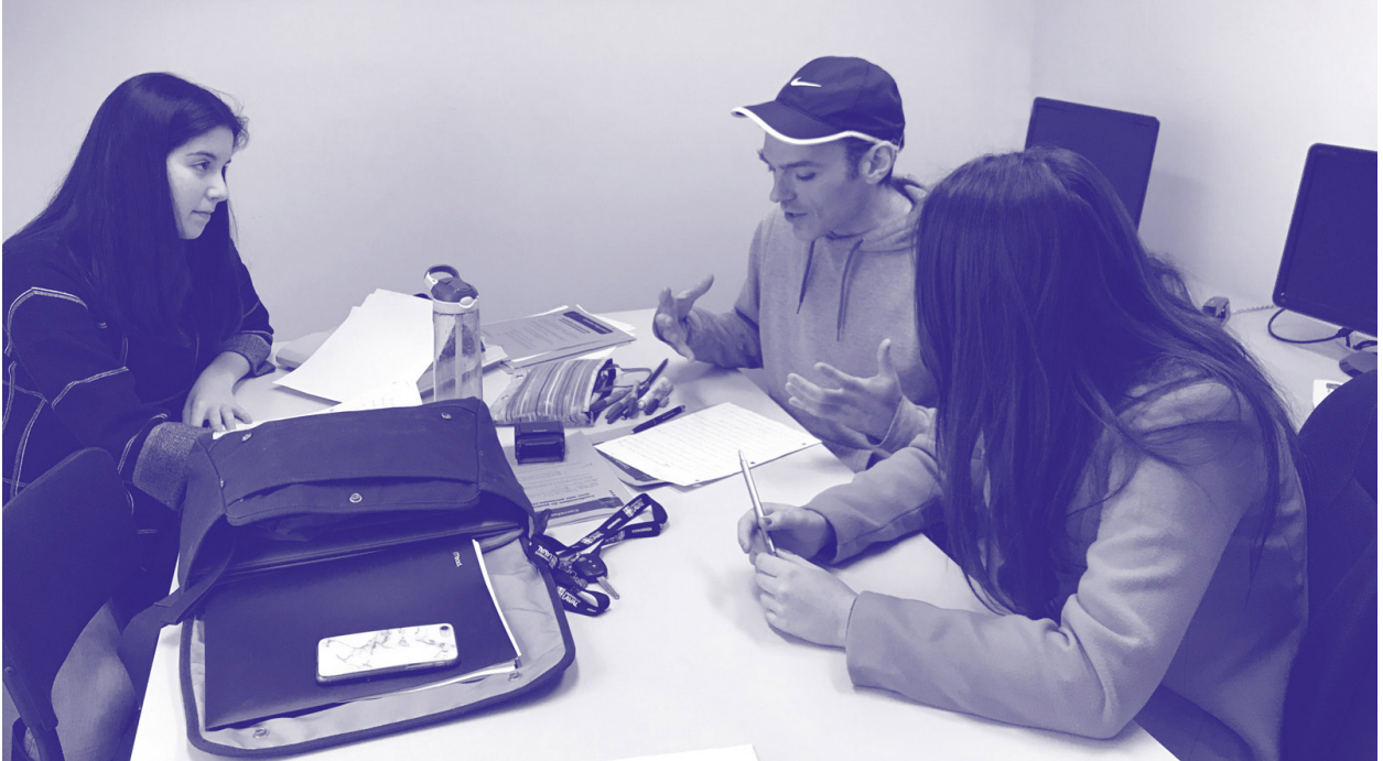
Étudiantes accompagnées au CAF par un tuteur dans la postcorrection d'un travail.

avec les départements, qui souhaitent recevoir de meilleures copies et qui sont encore plus motivés à signaler les erreurs langagières en sachant que des personnes-ressources assureront un suivi formateur à propos de celles-ci.