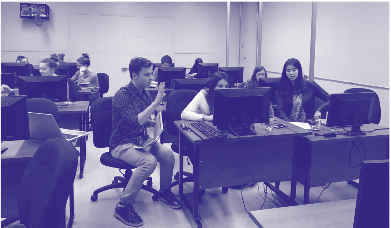
Groupe d'un cours d'histoire accompagné par l'enseignant titulaire et des tutrices du CAF pendant la rédaction d'un travail.