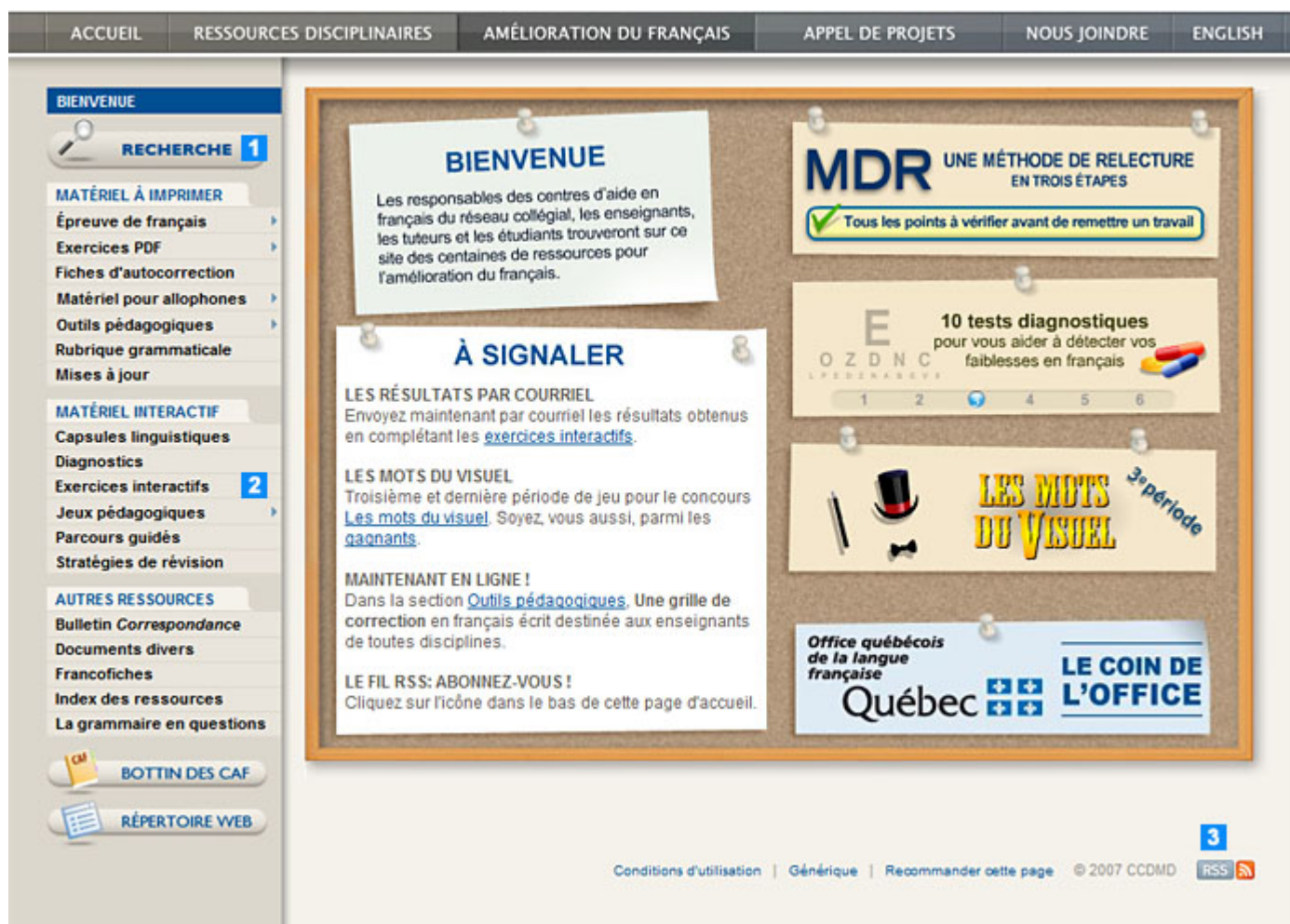
Figure 1 – Page d'accueil